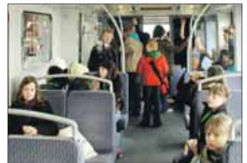
Sonderzug zum Girls' Day – mit Andrang im Cockpit

dem ans Ziel kommen, was Fahrdienstleiter/-innen leisten und wie ein reibungsloser Betriebsablauf gewährleistet wird.