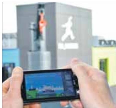
Mit dem Multi-Media-Guide die Elbinseln auf eigene Faust erkunden.