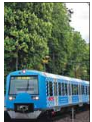
Weithin sichtbar schafft die S-Bahn Aufmerksamkeit für die IBA.