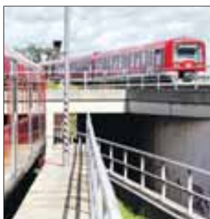
Spiegelblanke Züge der S-Bahn

Gerade, wenn S-Bahn-Züge mit Graffiti beschmiert sind, dürften noch mehr Stunden zusammenkommen.