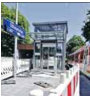
Am S-Bahnhof Othmarschen soll noch in diesem Jahr ein Aufzug in ihrer Mobilität eingeschränkter Menschen helfen, den Bahnsteig zu erreichen.

Durch ihre ebenerdige Lage sind acht Stationen ohnehin von mobilitätseingeschränkten Fahrgästen mühelos erreichbar, darunter Agathenburg und Dollern.