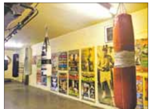
Auch internationale Boxergroßen waren schon zu Besuch auf St. Pauli