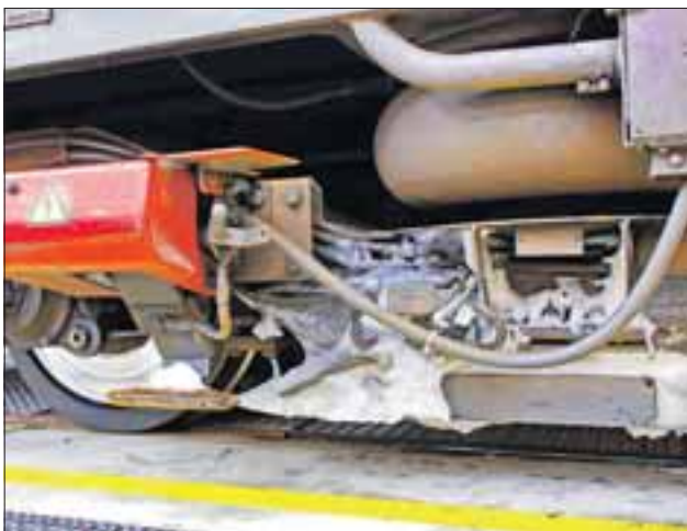
Ein Eispanzer hat sich am Stromabnehmer gebildet und behindert dessen Funktion

Herbstlaub auf den Gleisen hinterlässt einen Schmierfilm, der die Bremswirkung einschränkt.