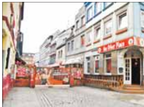
Der legendäre Eingang zur Herbertstraße