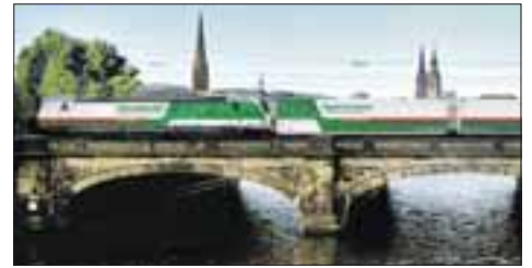
Der „Zug der Ideen“ ab 15. April in Hamburg

Damit ist die S-Bahn Hamburg das erste Eisenbahnverkehrsunternehmen in Deutschland, das ausschließlich Ökostrom für seine Fahrzeuge einsetzt