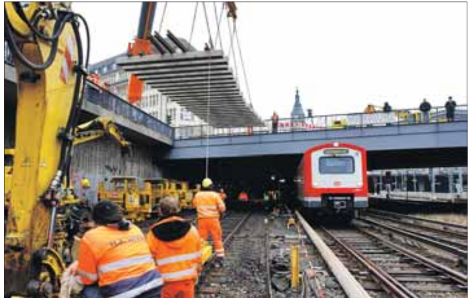
Ein Teilstück der Weiche liegt bereit zum Einbau

13 Weichen werden 2011 im Bereich des Hauptbahnhofs erneuert