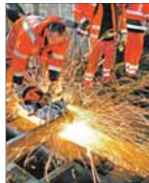
Knochenarbeit: Weichteile werden angepasst

Detaillierte Infos zu den Fahrzeiten und möglichen Fahralternativen erhalten Reisende im Internet unter der HVV-Fahrplanauskunft www.hvv.de .