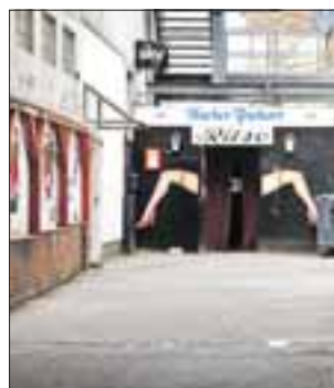
Hinter diesen Beinen wartet eine schlagkräftige Überraschung