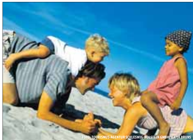
Strandvergnügen an der Ostsee

Am 18. April startet wieder der Ausflugsbus